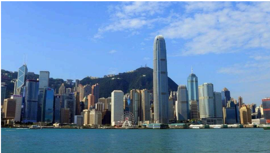
新能源、人工智能、智能基礎設施和ESG等領域對私募基金而言充滿挑戰。資料圖片